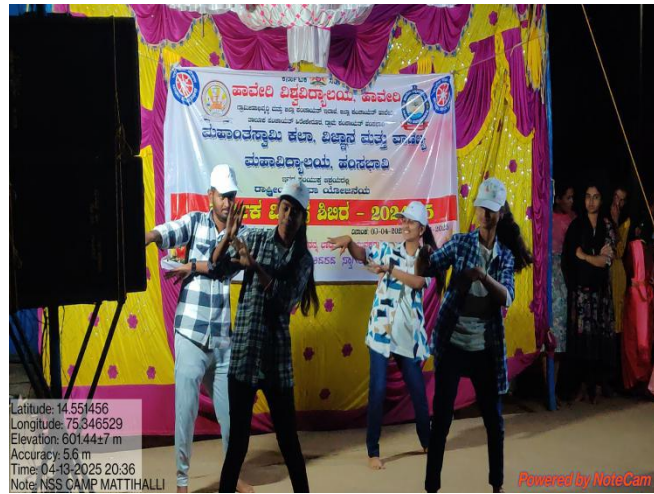
Latitude: 14.551456 Longitude: 75.346529 Elevation: 601.44±7 m Accuracy: 5.6 m Time: 04-13-2025 20:36 Note: NSS CAMP MATTHALLI