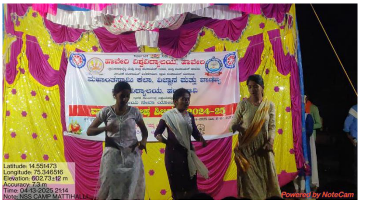
Latitude: 14.551473 Longitude: 75.346516 Elevation: 602.73±12 m Accuracy: 7.3 m Time: 04-13-2025 21:14 Note: NSS CAMP MATTHALLI