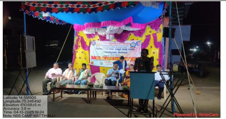
Latitude: 14.551505 Longitude: 75.346492 Elevation: 610.68±5 m Accuracy: 3.8 m Time: 04-13-2025 19:24 Note: NSS CAMP MATTHALLI