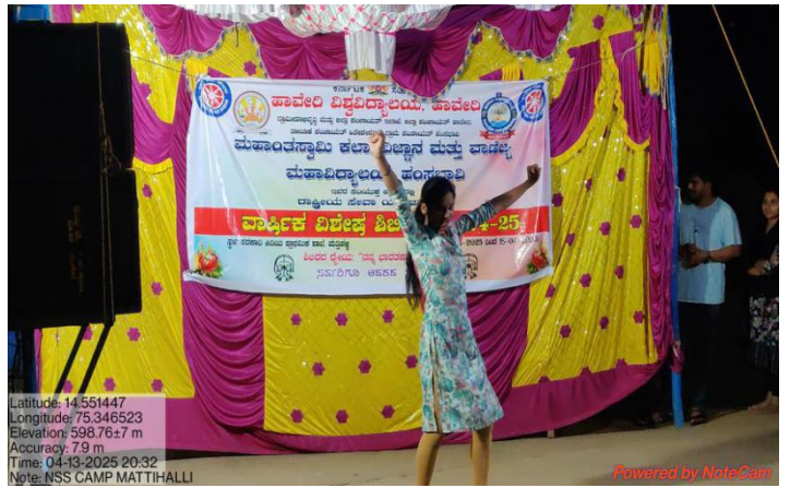
Latitude: 14.551447 Longitude: 75.346523 Elevation: 598.76±7 m Accuracy: 7.9 m Time: 04-13-2025 20:32 Note: NSS CAMP MATTHALLI