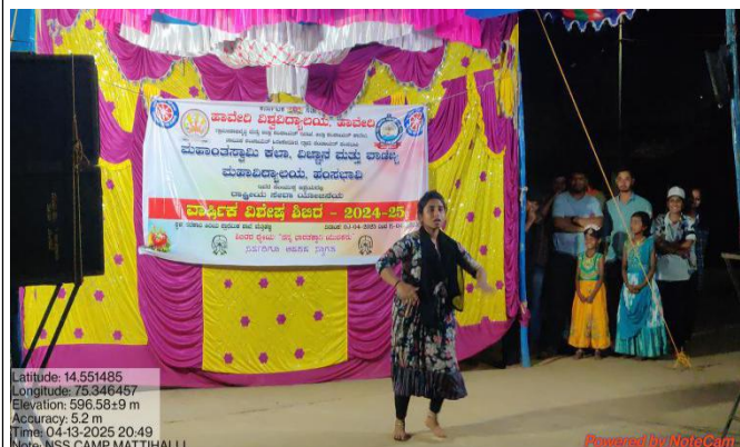
Latitude: 14.551485 Longitude: 75.346457 Elevation: 596.58±9 m Accuracy: 5.2 m Time: 04-13-2025 20:49 Note: NSS CAMP MATTHALLI