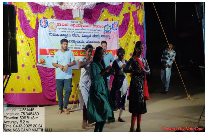
Latitude: 14.551445 Longitude: 75.346489 Elevation: 596.81±8 m Accuracy: 5.2 m Time: 04-13-2025 20:24 Note: NSS CAMP MATTHALLI