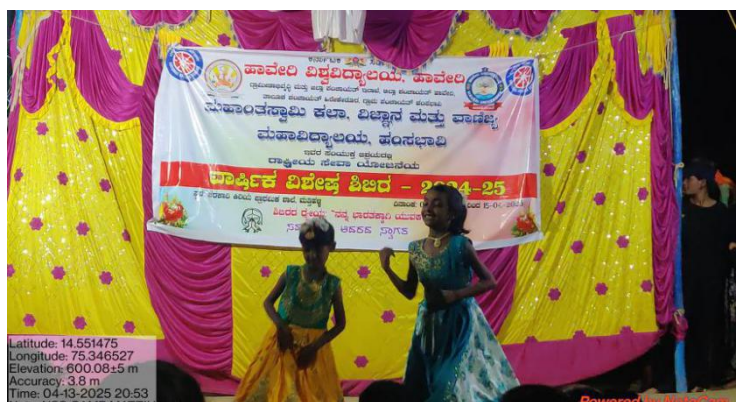
Latitude: 14.551475 Longitude: 75.346527 Elevation: 600.08±5 m Accuracy: 3.8 m Time: 04-13-2025 20:53 Note: NSS CAMP MATTHALLI