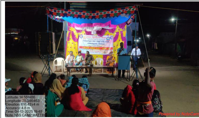
Latitude: 14.551486 Longitude: 75.346463 Elevation: 618.42±4 m Accuracy: 4.8 m Time: 04-13-2025 19:48 Note: NSS CAMP MATTHALLI