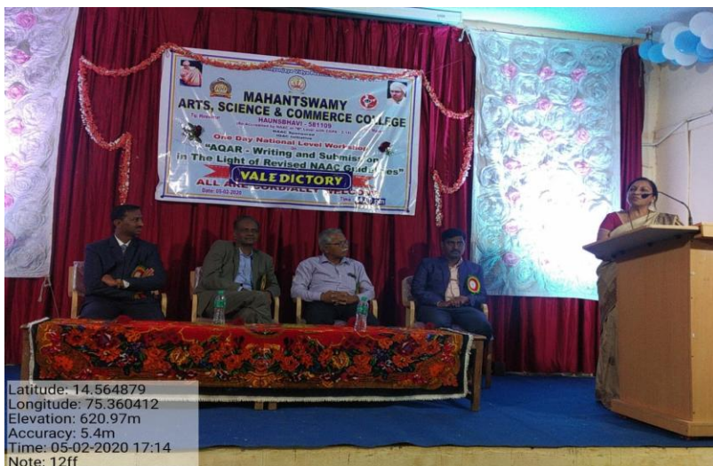
Delegates giving feedback