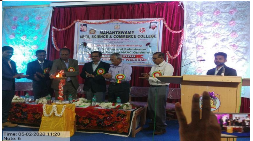
Inauguration of the Workshop